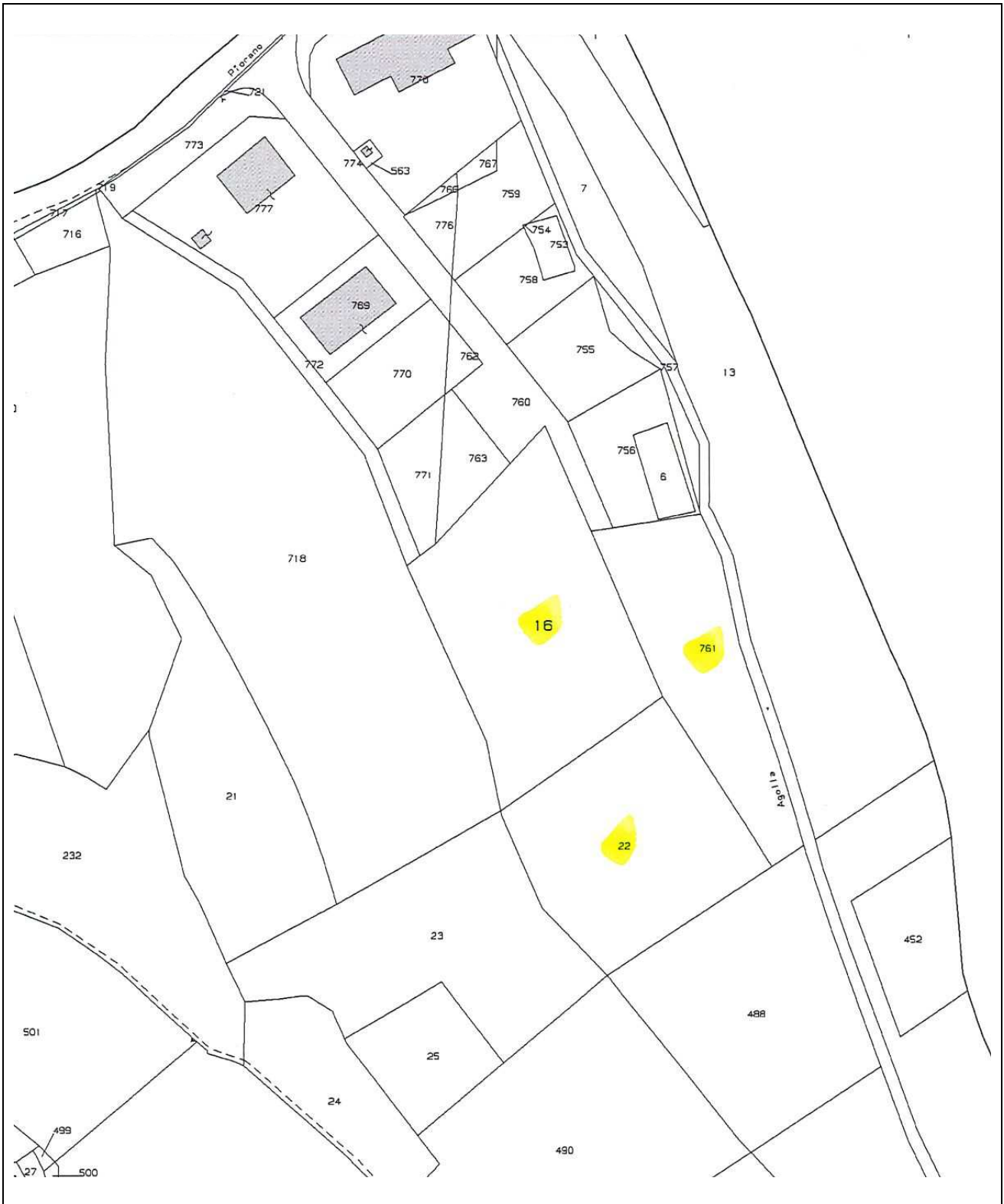
Estratto di mappa catastale Comune di Sefro - F. 13 P. 16, 22, 761 – Fuori scala – In giallo le particelle in oggetto