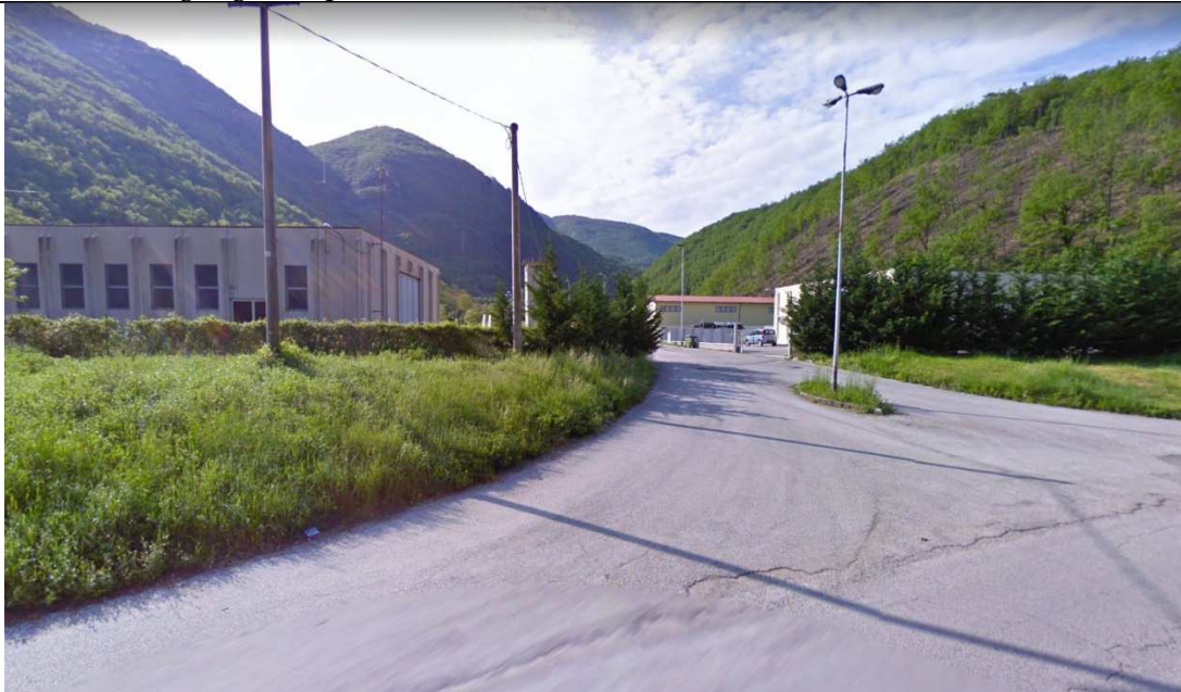
Immagine della strada di accesso alla Zona Artigianale in cui sono situati i lotti